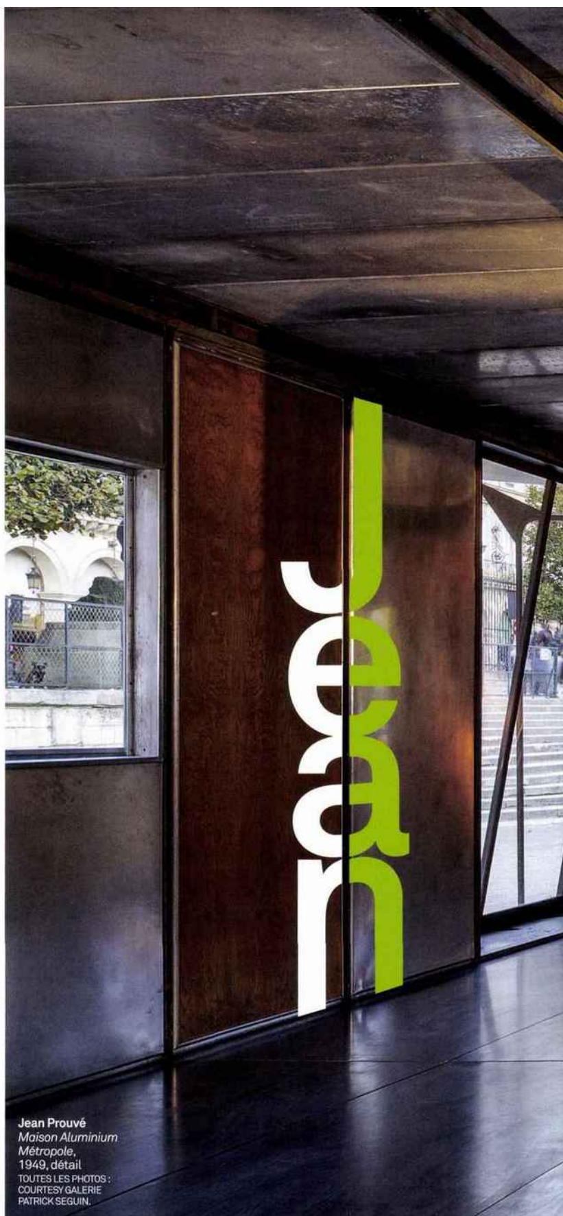
Jean Prouvé Maison Aluminium Métropole, 1949, détail