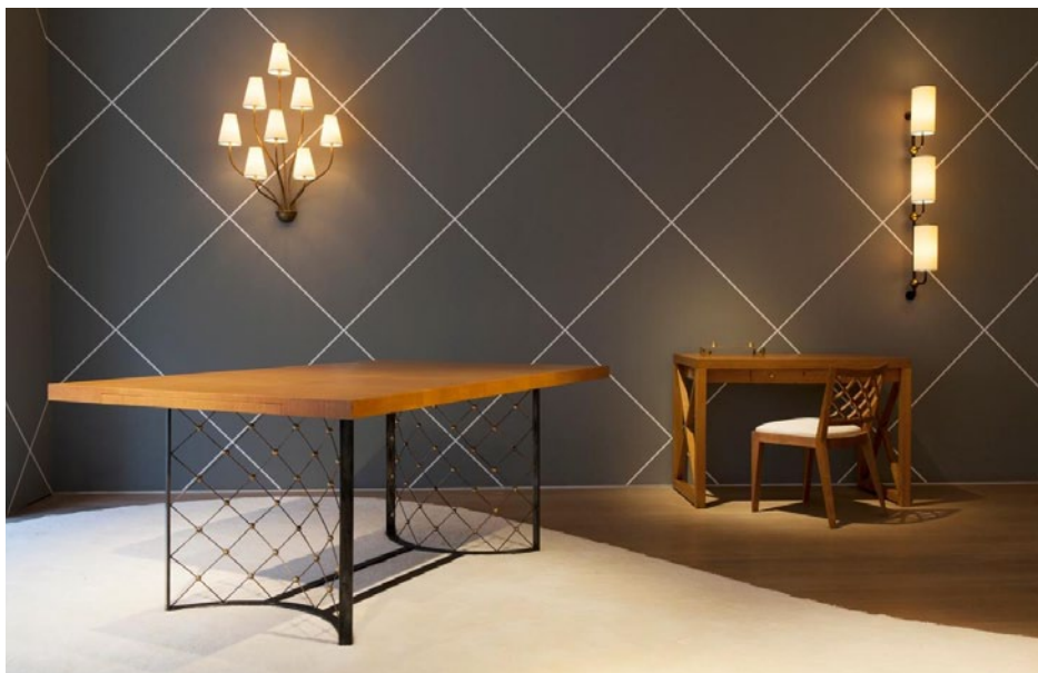
Vue de l'exposition « Jean Royère », à la galerie Patrick Seguin à Londres, avec la table Tour Eiffel (vers 1963).