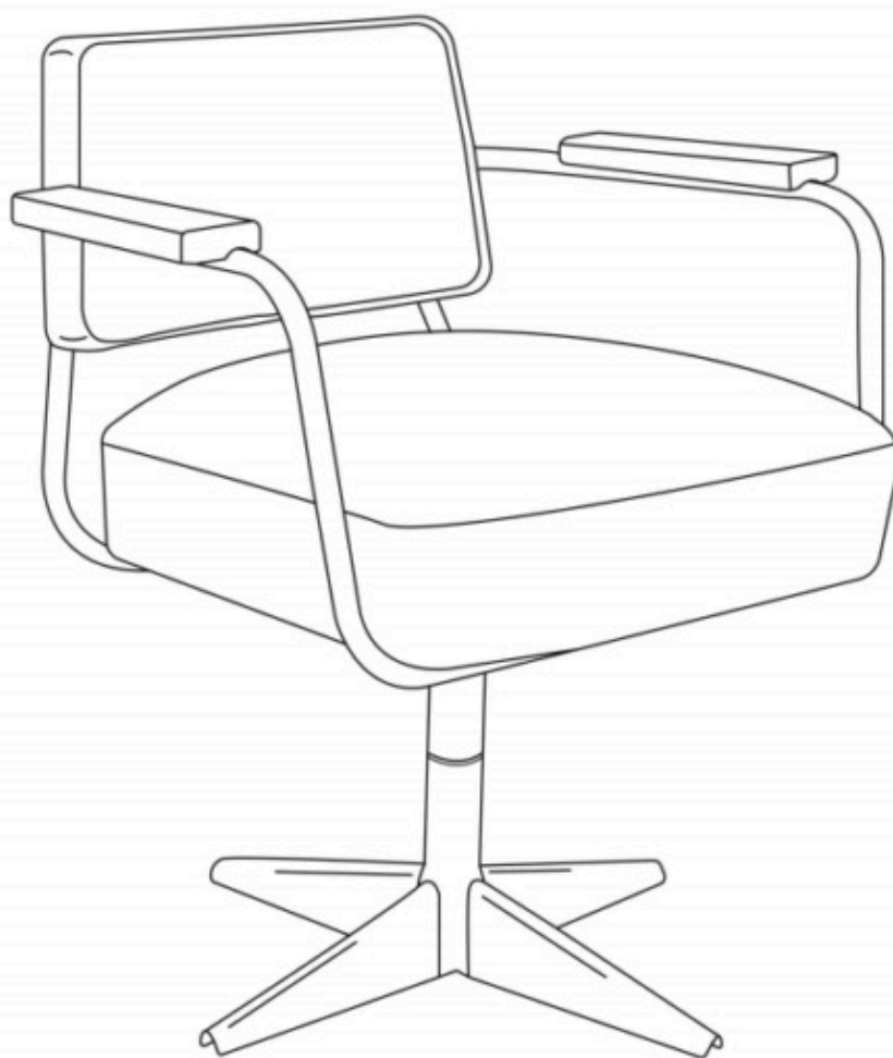
Swiveling office chair n°353, 1944

Раскраску можно бесплатно скачать на сайте галереи и заодно изучить, какие названия носят стулья и в каких годах их спроектировал Жан Пруве. Кроме того, это идеальный антистресс и хороший способ приглядеться к креслам, если вы рассматриваете что-то из знаковой модернистской мебели XX века для дома.