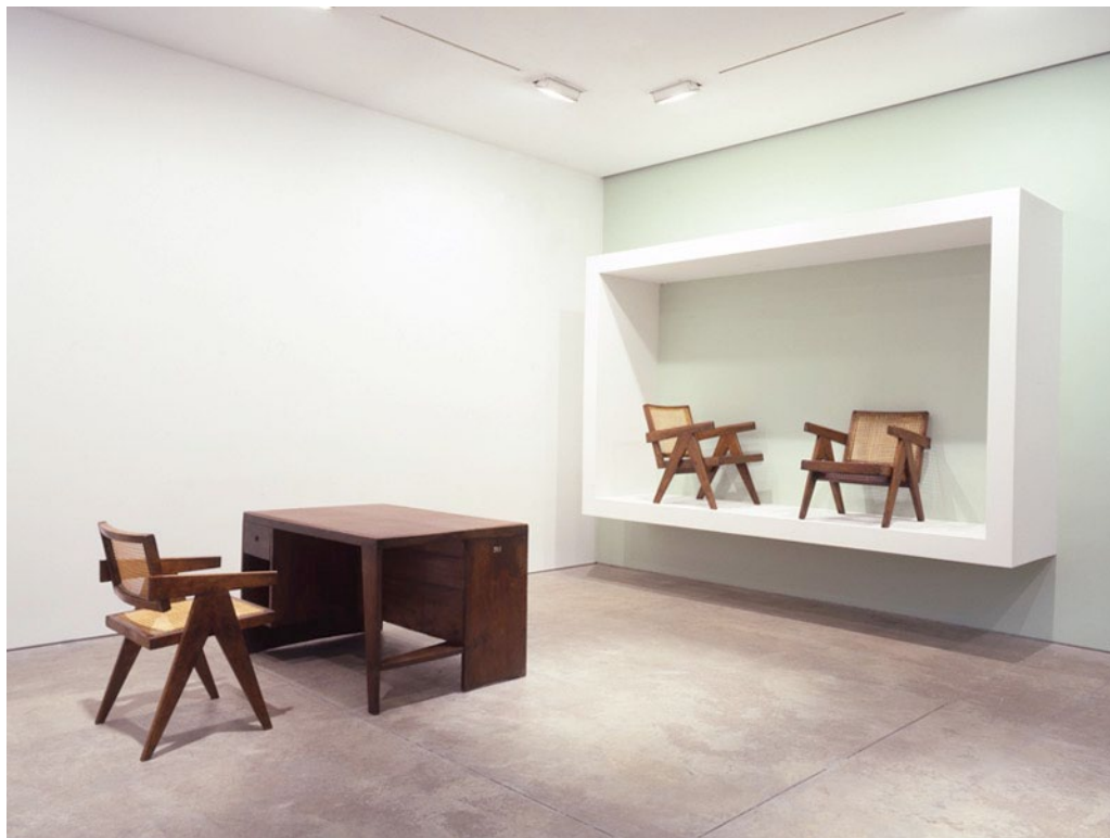
Le Corbusier / Pierre Jeanneret, Chandigarh, India, 1952-1956, conception par India Mahdavi, Sonnabend Gallery, New York, 18 fév. - 18 mars 2006.

Jeanneret supervise la construction de nombreux bâtiments : écoles, université, SUITE DU TEXTE P. 5