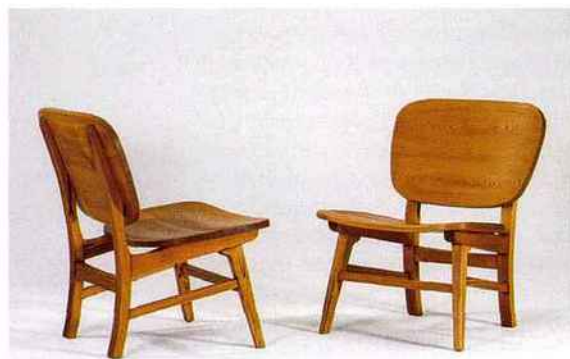
30_Greta Magnusson Grossman, Paire de fauteuils , 1950, pin sylvestre.