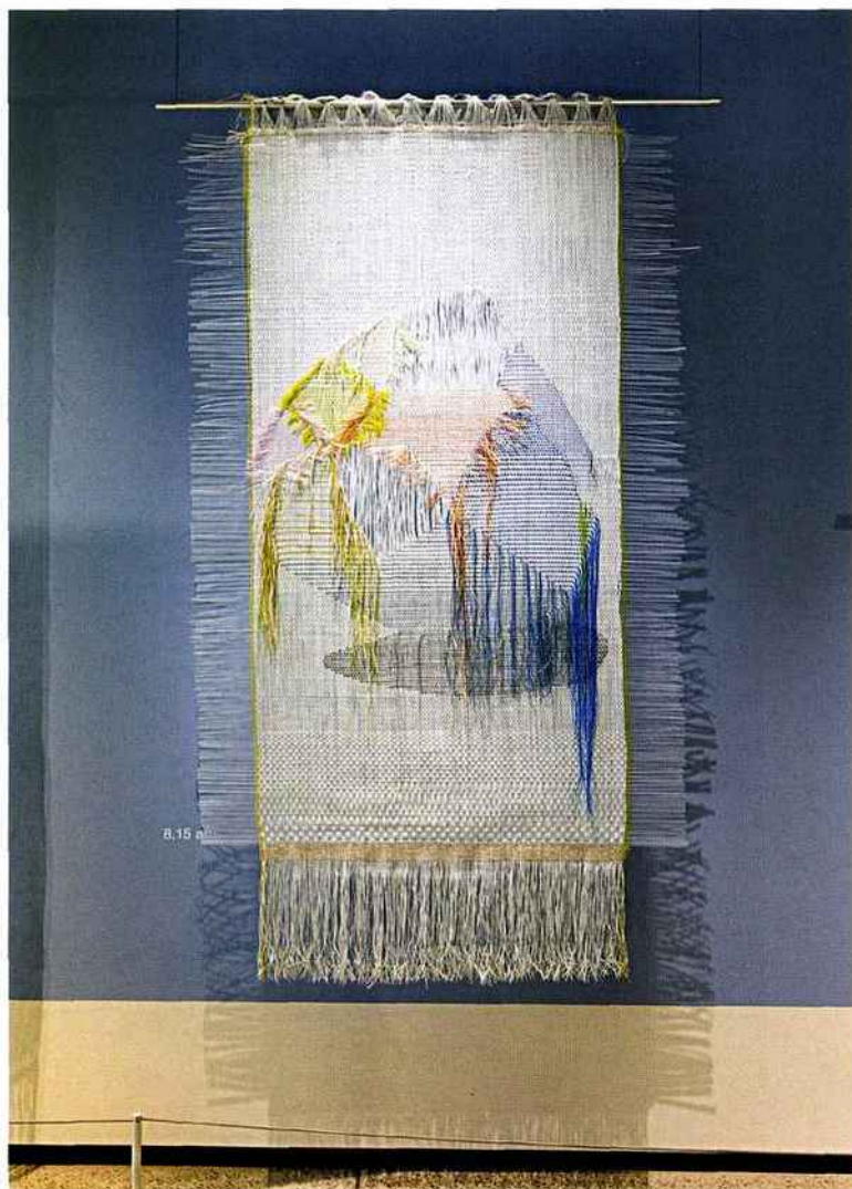
29_Hella Jongerius, 8:15 AM morning , 2017, tapisserie.